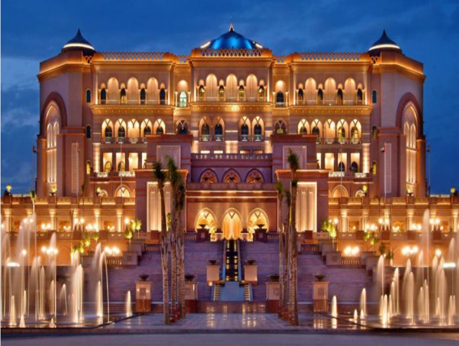
" صورة توضيحية لقصر الإمارات بإمارة أبو ظبي "

هو فندق راقٍ جداً تم بناؤه من قبل مُلاكه، حكومة أبوظبي، ويُدار من قبل شركة كمبيسنكي، يحتوي الفندق على ٣٠٢ غرفة، و ٩٢ جناحاً، والمبنى الرئيسي يمتد على مسافة الكيلومتر من الجناح الشرقي إلى الجناح الغربي، والحدائق والأراضي المُحيطة به فتغطي مساحة ١٠٠ هكتار، ويضم ١١٤ قبة، أبرزها القبة المركزية التي ترتفع ٧٢ متراً، ويغطي على الداخل الذهب وعرق اللؤلؤ والكريستال، ويحتوي ١٠٠٢ من الثريات تزن أكبرها ٥، ٢ طن، أيضاً سجدتان جداريتان مصنوعتان يدوياً عليهما صورة للفندق ذاته وتزن كل منهما ألف كغم (ياسين، ٢٠١١، ص ٢٢٨).